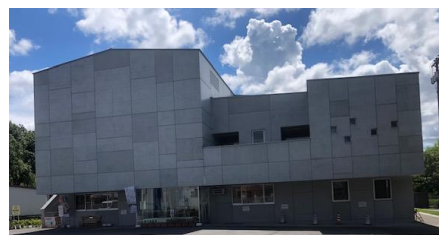
(会場である加茂野交流センター)